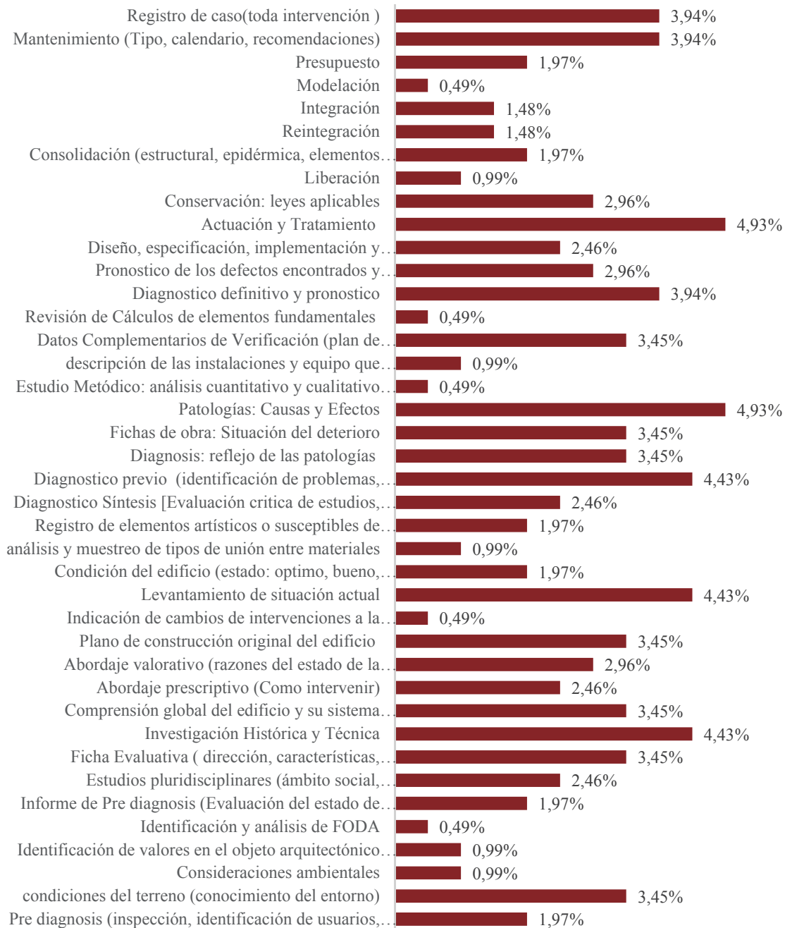
Figura 1. Frecuencia relativa de las Actividades. Elaborado por A. Fonseca R, L. Osorto N y M. Ramírez de Arellano B. (2015). Nota: Gráfica elaborada con base en los siguientes autores: Coscollano (2003), Vaz (1998), Casanovas (2007), Douglas (2005), Gurriaran et al. (2009), Ceballos (1995), Correia (2007), Feilden (2007), Chávez & Álvarez (2005) y AEEBC (1994).