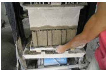
Figura 2. Fabricación del bioconcreto

En la siguiente figura se observa el proceso de elaboración de los bloques, utilizando cascarilla de café (bioconcreto).