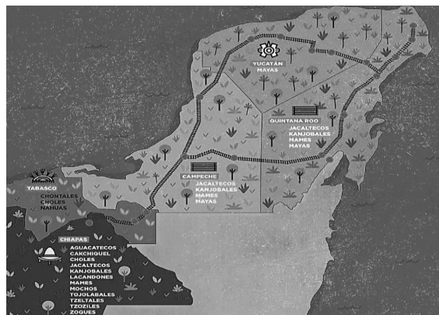
Figura 2. Pueblos indígenas en Campeche, Chiapas, Tabasco, Yucatán y Quintana Roo

En la Figura 2 se muestran los principales pueblos indígenas que se encuentran en cada uno de los estados de Campeche, Chiapas, Tabasco, Yucatán y Quintana Roo.