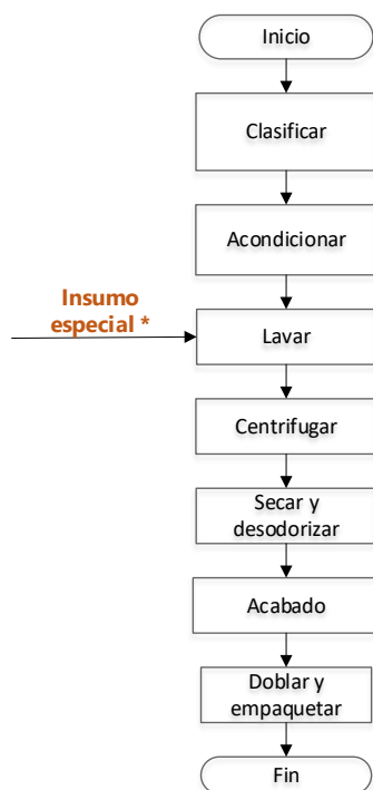
Figura 2. Flujograma de la técnica de lavado en seco y acabado ecológico Fuente: Elaboración propia

A continuación, se detallan los parámetros de control identificados en cada operación: