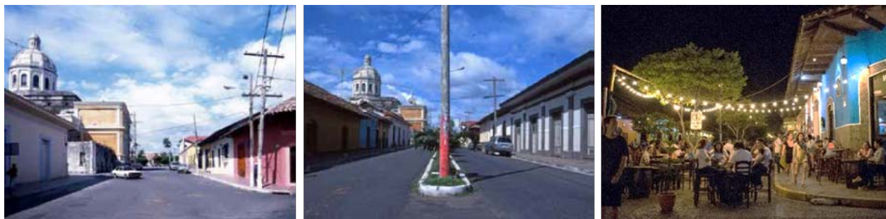
Figuras 2: Calle La Calzada 1997; Figuras 3: Calle La Calzada 1997; Figura 4: Calle La Calzada, 2017

Por otra parte, los proyectos del parque y las plazas centrales (1992-1997), y la revitalización de La Calzada (2004-2006) (ver imágenes 2, 3 y 4), cambiaron significativamente la imagen y el paisaje urbano histórico, incentivando de forma directa que se diera otra dinámica en el sitio, seguida por intervenciones puntuales llevadas a cabo por agentes privados, y que han consistido específicamente en intervenciones en inmuebles particulares para otorgarles una nueva función (que va de viviendas a restaurantes, cafeterías, hoteles o tour operadoras).