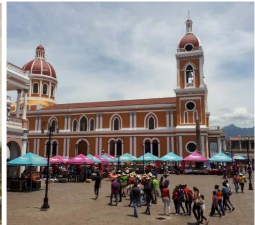
Figura 5: Entorno de la Catedral, inicios de 1990. Fuente: archivo OTGCH, 2000; Figura 6: Entorno de la Catedral en 2017, el turismo apoderado del espacio urbano del centro histórico. Fuente: INTUR, 017

Por su parte, Carrión (2001) plantea que los procesos de cambio por el turismo, han propiciado en muchos centros históricos latinoamericanos, que hoy cuestionen si estas dinámicas implican una ruptura con el modelo de ciudad que se venía construyendo, o si, por el contrario, representa