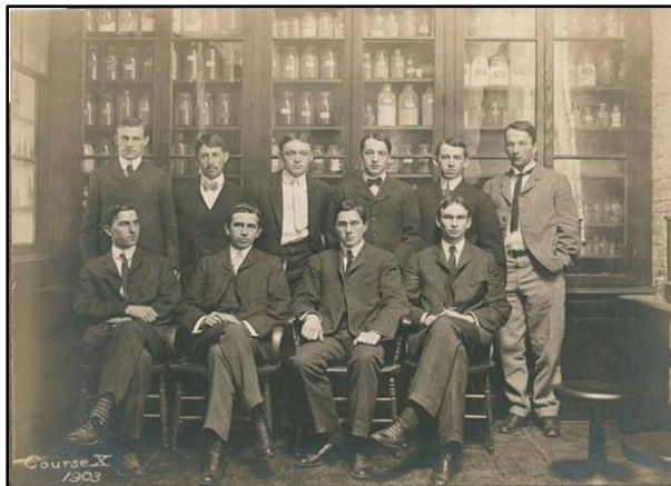
Curso X en 1903

El Curso X - Ingeniería Química era esencialmente Ingeniería Mecánica con algunos cursos de Química Industrial. El Curso X fue diseñado para satisfacer las necesidades de los estudiantes que desearan una enseñanza formal de Ingeniería Mecánica y simultáneamente dedicar parte de su tiempo al estudio de la aplicación de la Química a las artes de la Ingeniería especialmente con aquellos problemas que se relacionan con el uso y manufactura de productos químicos.